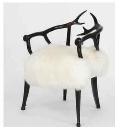
L'IG Siège de Liffol a été décernée en décembre 2016. Ici, un fauteuil cerf Henriot et Cie.