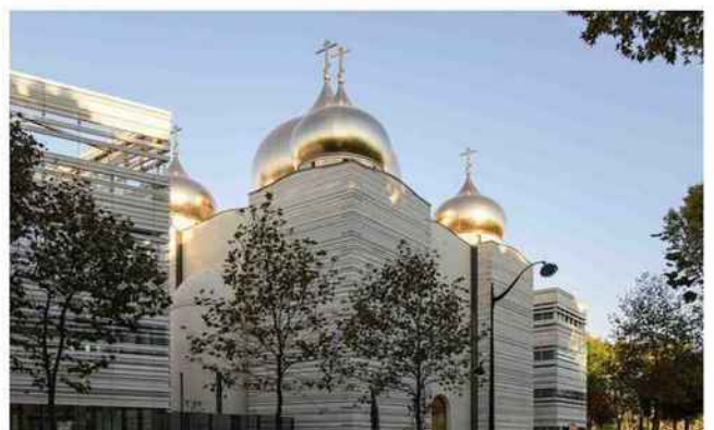
Pour le Centre spirituel et culturel orthodoxe russe à Paris, dont la construction a débuté en 2014 et a été finalisée en 2016, l'architecte français Jean-Michel Wilmotte a opté pour la pierre de Bourgogne.