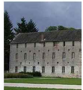
La pierre de Bourgogne a l'honneur à l'abbaye Notre-Dame de Citeaux (21).