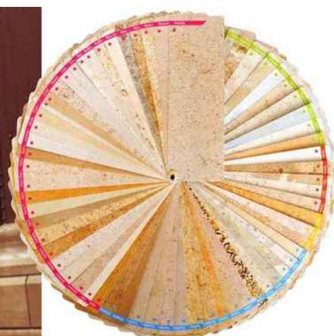
La pierre de Bourgogne s'exprime en un large nuancier de couleurs, du jaune au bleu en passant par le gris, le rouge...

www.ig-pierredebουργogne.fr www.pierre-bουργogne.fr