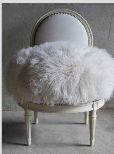
L'IG Siège de Liffol (88) a été la première attribuée en France. Ici un fauteuil Cupidon by Counot Blandin.