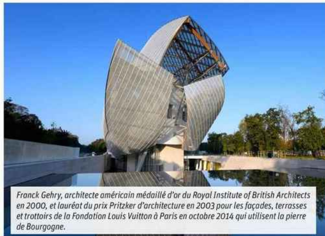
Frank Gehry, architecte américain médaillé d'or du Royal Institute of British Architects en 2000, et lauréat du prix Pritzker d'architecture en 2003 pour les façades, terrasses et trottoirs de la Fondation Louis Vuitton à Paris en octobre 2014 qui utilisent la pierre de Bourgogne.