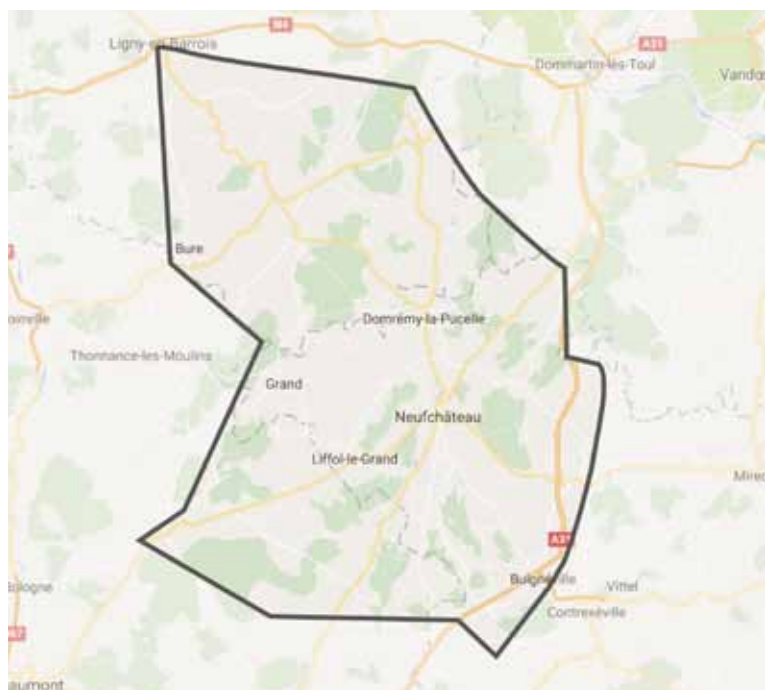
Territoire Indication Géographique “Siège de Liffol”

Notons que l'ensemble de ces savoir-faire séculaires sont encore précieusement conservés et transmis par de nombreuses manufactures lorraines, perpétuant ainsi un véritable patrimoine culturel vivant pour les prochaines générations.