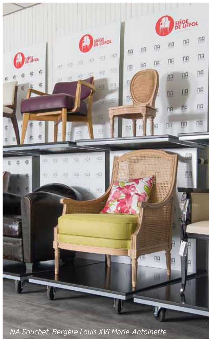
NA Souchet, Bergère Louis XVI Marie-Antoinette

Outre les sièges, la scénographie apporte la reconnaissance d'une production d'excellence, depuis 155 ans, sur le bassin liffolois.